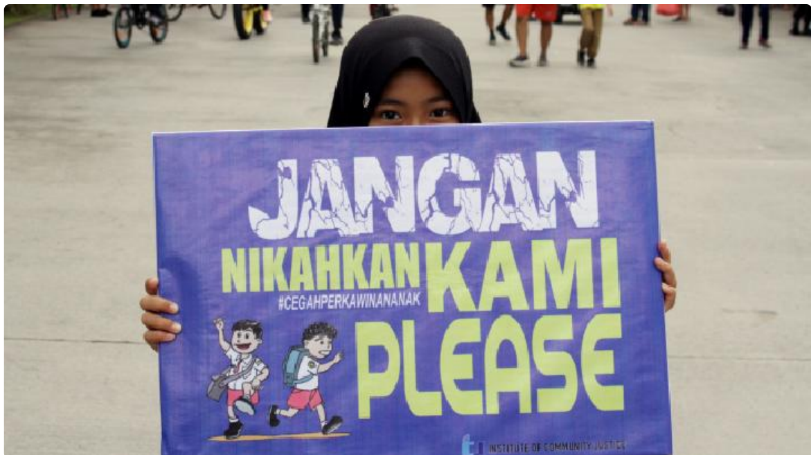
Ilustrasi aksi anti perkawinan anak.

Arri menekankan bahwa perkawinan anak dapat mengakibatkan berbagai macam dampak negatif pada anak perempuan. Misalnya saja dari segi biologis. Ketika perempuan menikah di usia anak, ia akan mendapatkan risiko komplikasi pada kehamilan. Komplikasi ini dapat hadir dalam bentuk persalinan macet hingga konsekuensi kesehatan pada bayi. Sementara itu, aspek psikologis dari anak perempuan ini akan banyak terganggu.